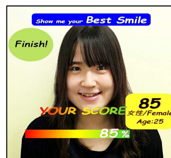
【笑顔診断後のスクリーン】